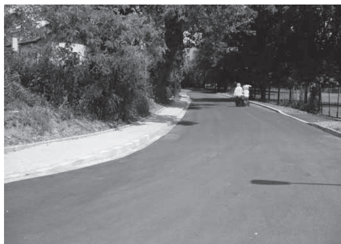
ul. Stróża Rybna

Do 30 czerwca wyremontowano łącznie 1045 m 2 powierzchni komunikacyjnych ruchu pieszego oraz poprawiono stan techniczny prawie 2000 m 2 nawierzchni jezdni dróg gminnych. Łączne nakłady inwestycyjne na remont, modernizację dróg i chodników w pierwszym półroczu wyniosły ok. 396 899 zł.