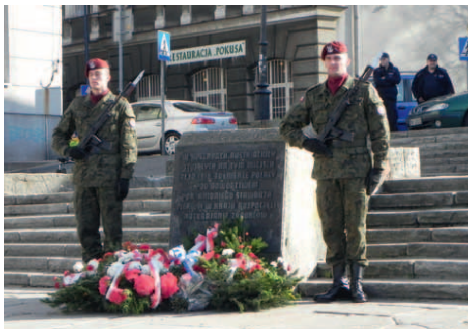
fol. MH. Trynka