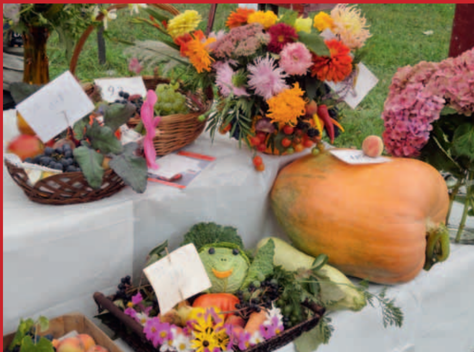
Wystawa plonów w ROD Płaszów