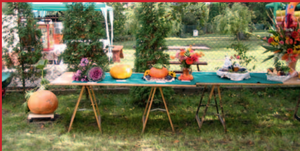
Dzień Działkowca ROD ZAKOLE Wisły 21.09.2013

Biuro Dzielnic XIII Rynek Podgórski 1, pokój 12 tel. 12 656 62 25, tel./fax 12 423 55 29 www.dzielnica13.krakow.pl e-mail: rada@dzielnica13.krakow.pl